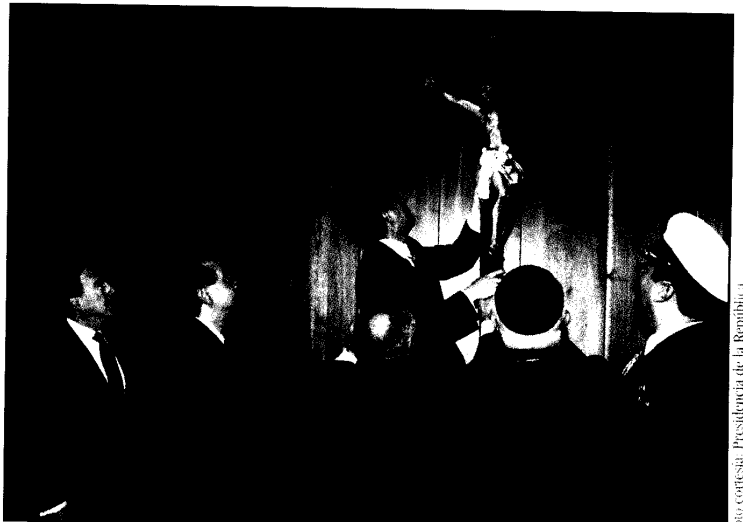
Momento de la entronización del Cristo rescatado del holocausto del Palacio de Justicia de 1985 en las nuevas instalaciones de la Sala Plena de la Corte Suprema dentro del Palacio de la Rama de Santafé de Bogotá. Abril 29 de 1999.

http://www.fij.edu.co/ (Publicaciones de la Rama Judicial) Santafé de Bogotá D.C. - Colombia