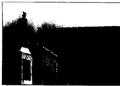
Palacio de Justicia, Manizales