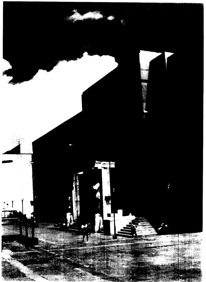
Palacio de Justicia de Bucaramanga, sede del Distrito Judicial.

Oficina de Comunicación y Prensa Carrera 7a. No. 27-18 piso 12 Tel: 3410232 Fax: 2847094 http://www.fij.edu.co/ (Publicaciones de la Rama Judicial) Santafé de Bogotá D.C. - Colombia