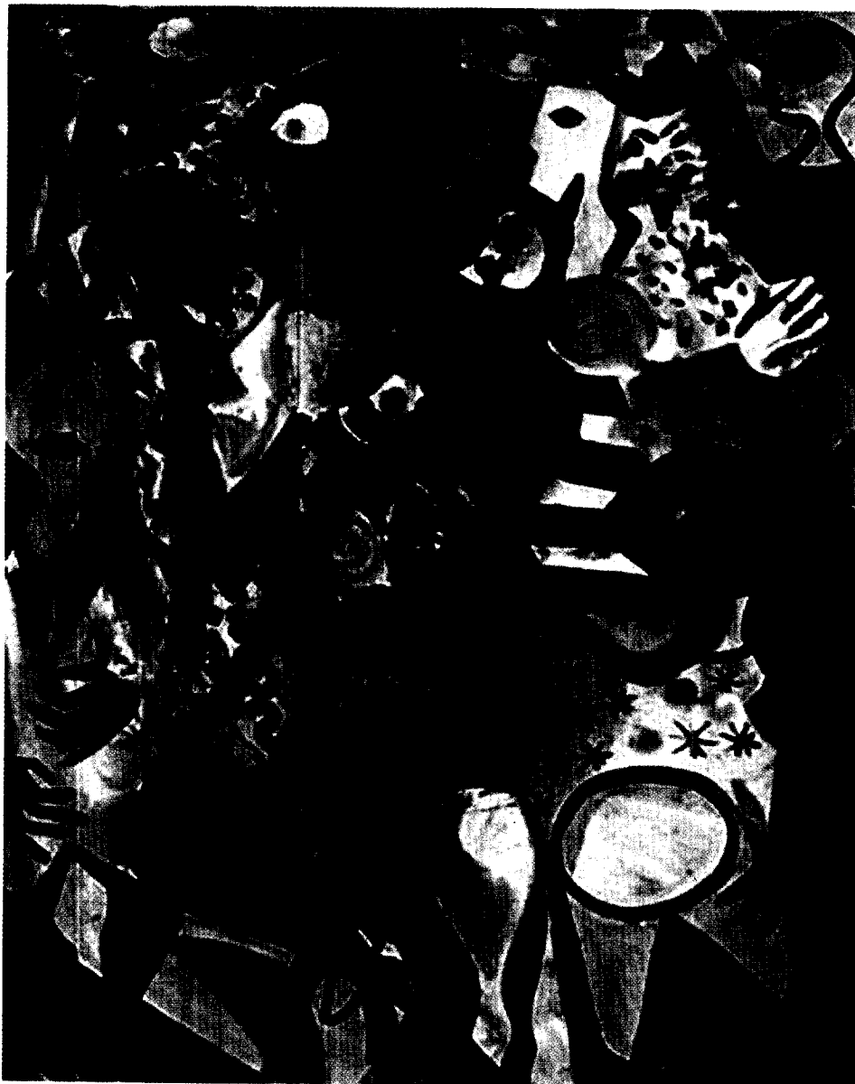
Emiliano di Cavalcanti