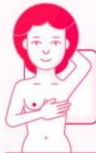
En la cama