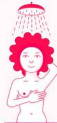
En la ducha