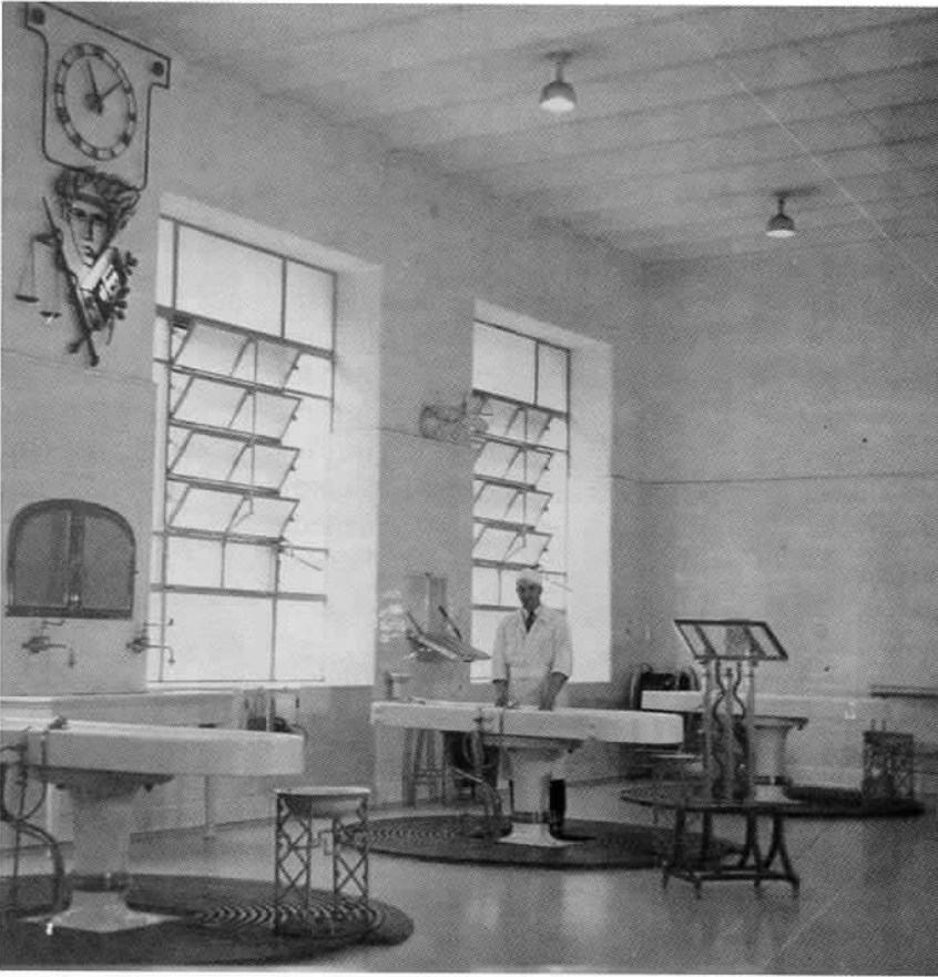
Primera Sala de Autopsias de la Morgue Judicial.