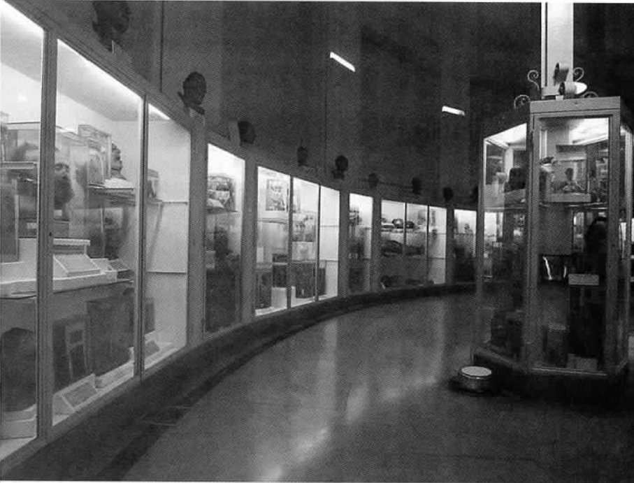
Vista actual del Museo de la Morgue Judicial.